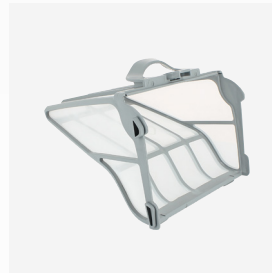
Filterbak Stevig, zeer fijn filter met grote inhoud (5 liter)